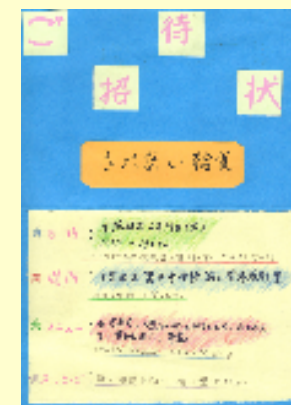
事前に生徒からの招待状が参加者に届けられました