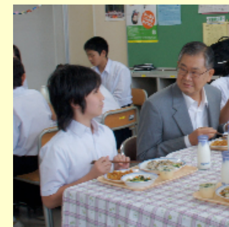
6中の2年B組の教室で