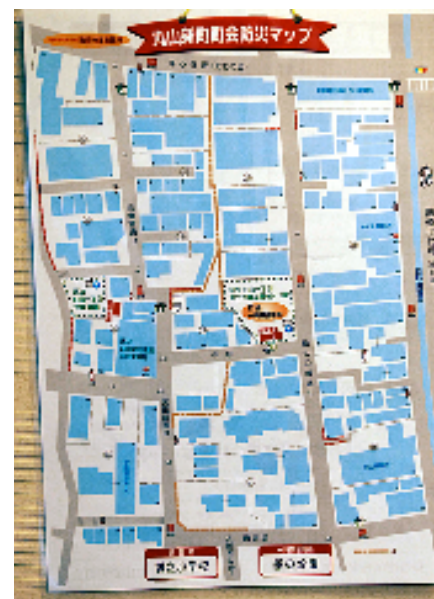
他町会の防災マップ見本

大災害が発生したとき町会の皆様が安全・迅速に非難が出来るように、町会の中に防災に関係したもので消火器・消火栓などが設置されて