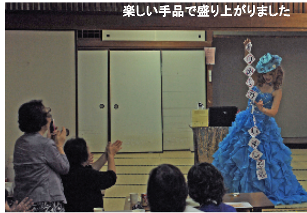
楽しい手品で盛り上がりました