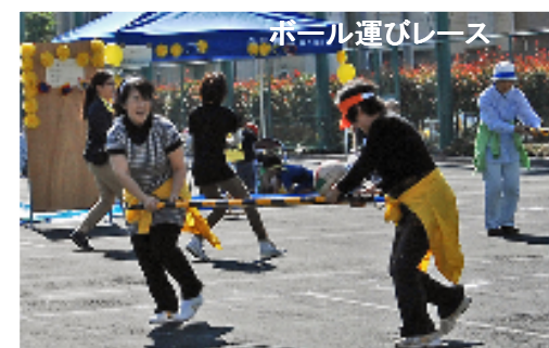
ボール運びレース

秋というのに夏のような日差しとなった10月21日、初めて家族で出場させていただきました。中町会チームは昨年優勝していて幾分かプレッシャーがありました。趣向を凝らした競技は盛り沢山で子供からシニアの方まで、どれも楽しく参加できるものでした。競技が進むにつれ、初めてお会いする方と打ち合わせや勝どきを上げるようになりました。どこの町会も大声援で盛り上がり、最後の競技綱引きで優勝が決まることになりました。娘2人(3才と5才)も精一杯の応援をしてくれたことが勝利の女神となったのでしょうか。そして町会の美しき女性パワーで全勝して優勝を決定づけることになりました。本年も優勝できたことに胸をなでおろし、心地よい筋肉痛で久しぶりの満足感でした。ぜひ皆様も参加してみてくださいはかがでしょうか?