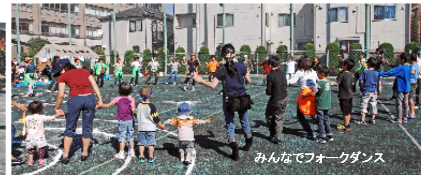
みんなでフォークダンス