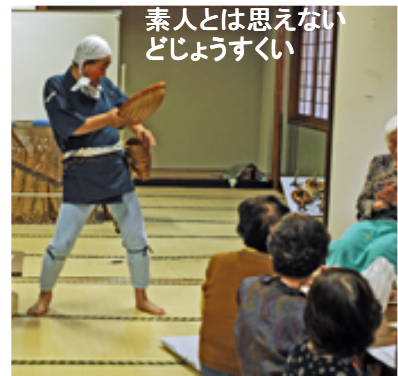
素人とは思えない どじょうすくい